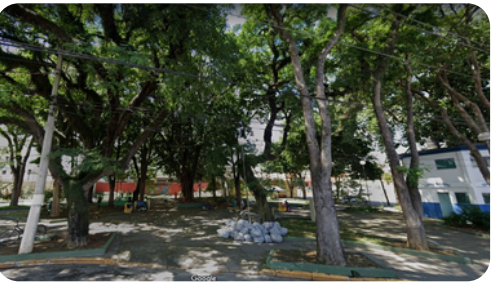
ROD. GENERAL EURYALE DE JESUS ZERBINE (AV. FRANCISCO FERREIRA LOPES)