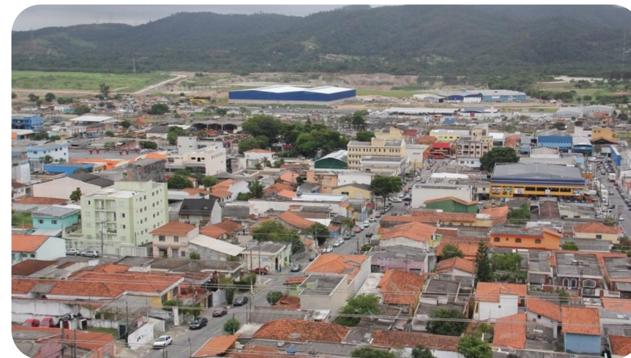
BRÁZ CUBAS É O 2º DISTRITO MAIS POPULOSO DE MOGI DAS CRUZES