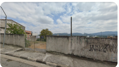
AV. MANOEL ALVES