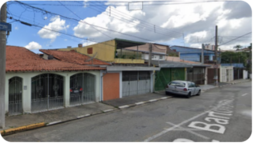
R. BARTOLOMEU BUENO DA SILVA