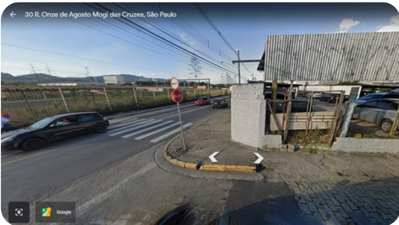
R. ONZE DE AGOSTO