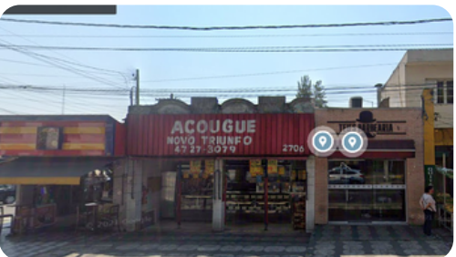
ROD. GENERAL EURYALE DE JESUS ZERBINE (AV. FRANCISCO FERREIRA LOPES)