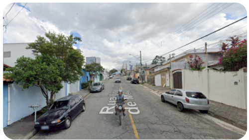
RUA FRANCISCO AFFONSO DE MELO