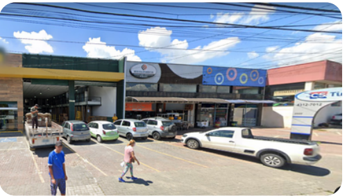
ROD. GENERAL EURYALE DE JESUS ZERBINE (AV. FRANCISCO FERREIRA LOPES)