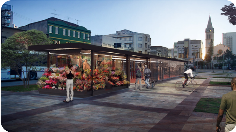
BICICLETÁRIO LARGO DA BATATA