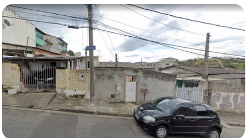
RUA SANTA CECÍLIA