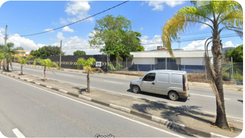
ROD. GENERAL EURYALE DE JESUS ZERBINE (AV. FRANCISCO FERREIRA LOPES)